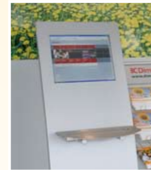
Interaktive Info-Terminals: Grafische Animationen liefert das Internet