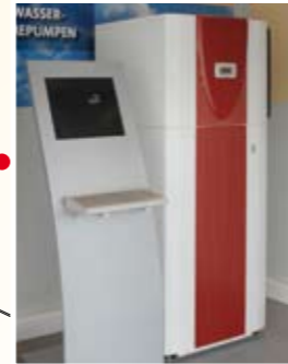
Einfache Installation: Luft/Wasser-Wärmepumpe zur Innenaufstellung