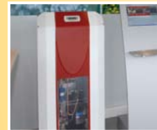
Blick ins Innere der Technik: Wärmepumpe für die Wärmequelle Grundwasser

Dimplex Wärmepumpen versorgen Gebäude zu 100 % zuverlässig mit Wärme. Dies gilt für die Raumheizung und Warmwasserversorgung – sowohl im Neubau als auch bei der Modernisierung. Dabei lässt sich die Effizienz der bewährten und ausgereiften Wärmepumpentechnik durch die Kombination mit einer Solaranlage nochmals steigern.