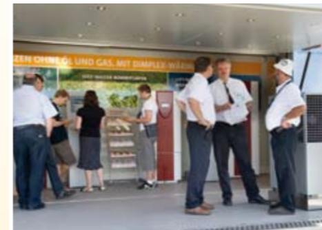
Beratung, die ankommt: Information direkt vom Fachmann