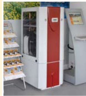
Energie aus dem eigenen Garten: Wärmepumpe für die Wärmequelle Erdreich

Wärmepumpen-Exponate, Animationen an interaktiven Terminals und Funktionsmodelle vermitteln Ihnen ein überzeugendes Bild der modernen Wärmepumpentechnik.