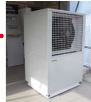
Mehr Platz im Keller: Luft/Wasser-Wärmepumpe zur Außenaufstellung